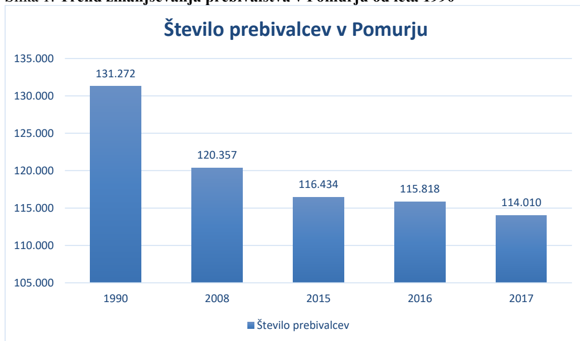
Slika 1: Trend zmanjševanja prebivalstva v Pomurju od leta 1990

Trend izrazitega zmanjševanja prebivalstva v regiji prikazuje slika 1.